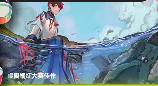
虛擬網紅大賽佳作