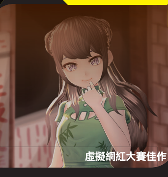
虛擬網紅大賽佳作